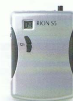
FM 送信機 S5