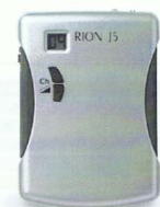
FM 受信機 J5