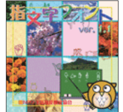
手話検定協会から発売のフォント (定価1,000円)

HP「マンガの中の聴覚障害者」の「手話のフォント」のページに入ると、入手可能な指文字フォントが網羅されています。フリーフォントが15種類ぐらいあります。