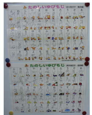
「全国早期支援教育研究協議会」作成の指文字表「たのしいゆびもじ」。自分から見たとき用と、相手から見たとき用の2種類(両方B3版)で1セット(定価1,000円)