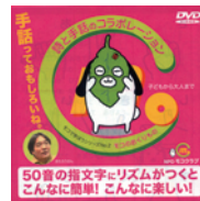
NPO モコクラブ制作、 『モコのおくりもの』、 定価 1,500円

以前紹介したことがあります。50音の指文字にリズムをつけた『ゆびもリズム』のDVDを幼児さんと一緒に見ながら、リズムを取って表すことも、好きなお子さんも多いです。