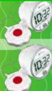
ベルマンアラームクロック クラシック