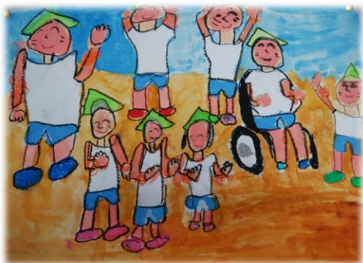
平成 29 年度 小学部児童作品「運動会の思い出」